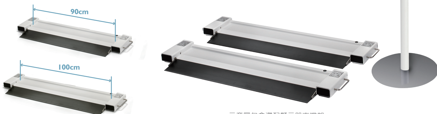
示意圖包含選配顯示器支撐架

量測完成後，透過 USB 或是無線傳輸，將測量結果傳輸至電子病歷系統，減少手寫資料的錯誤率，輕鬆整合量測數據。